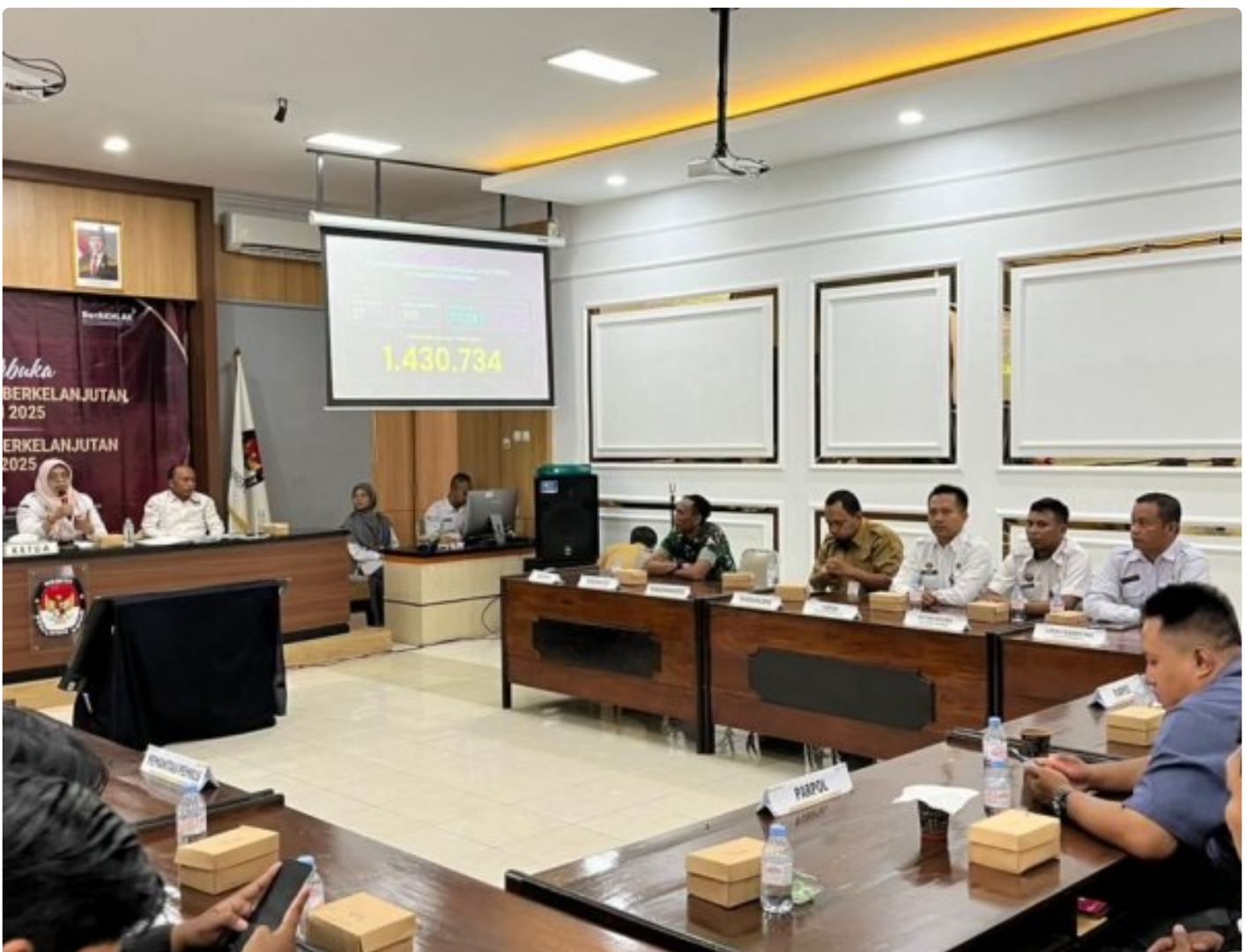
Perkuat Strategi Pembinaan, Rapat Koordinasi Assesment Warga Binaan Bersama Peserta Magang Lapas Purwokerto

PURWOKERTO - apas Kelas IIA Purwokerto menggelar rapat koordinasi terkait rencana pelaksanaan assesment warga binaan sebagai langkah awal dalam memperkuat strategi pembinaan yang lebih tepat sasaran, pada 08/12'24.